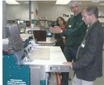
Jetzt auch in XL: Das Prä-Deka-System mit Modulen zum Anleimen, Pappe-Auflegen und Einschlagen.

ge wird das Kapitalband mittels doppelseitigem Klebeband automatisch am eingelegten Buchblock angebracht. An den Partnerständen präsentierten mehrere Kooperationspartner ebenfalls neue Maschinen und Materialien. In Sachen Veredelung bot Polatec Live-Demonstrationen des neuen Thermo-Kaschiersystems Eclipse Tornado. Ricoh Deutschland hatte das neue Farbdrucksystem Ricoh C7100 ausgestellt. Die Fünf-Farb-Option der bis zu 80 Blatt pro Minute schnellen Produktionsdruckmaschine bietet die Möglichkeit, mit transparentem oder weißem Toner zu drucken. Für die Buchherstellung präsentierte Planatol-Wetzel einen neuen Planamelt-Klebstoff, und Fibermark zeigte edle Metallic-Buchgewebe.